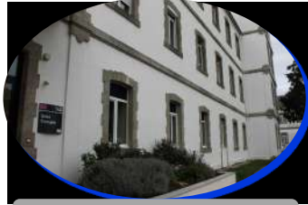
Unité Tremplin - Saint-Avé