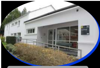
En Arbenn - Saint-Avé