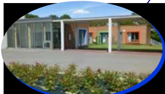
FAM Guérignan - Bignona