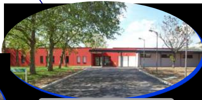
MAS Kerblay - Sarzeau