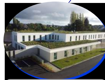
Centre Psychothérapique Pour Adolescents