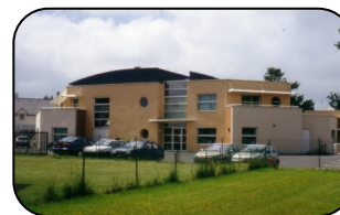
CPEA Beaupré-Lalande (Vannes)