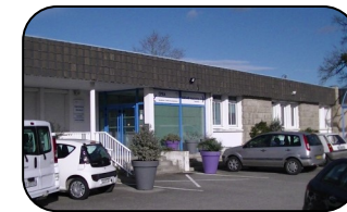
CPEA Ménémur (Vannes)

Les informations sont enregistrées dans un Dossier Patient Informatisé permettant d'assurer la continuité des soins. L'ensemble des logiciels informatiques utilisés par l'EPSM Morbihan est soumis et a fait l'objet d'une autorisation par la CNIL (Commission Nationale des Informations et Libertés) dans les conditions fixées par la loi n°78-17 du 6 janvier 1978 relative à l'informatique, aux fichiers et aux libertés.