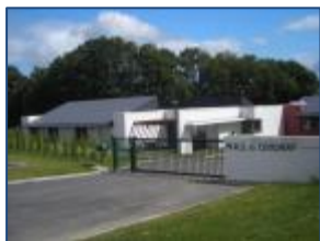
MAS du Coudray LA CHAPELLE CARO