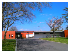
MAS de Kerblay SARZEAU

HORAIRES 08H30 - 12H30 13H30 - 16H30 les lundis, mercredis et vendredis