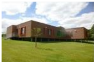
FAM Guérignan BIGNAN