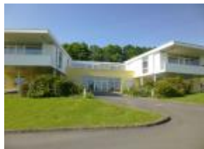
FAM Keruhel MONTERBLANC