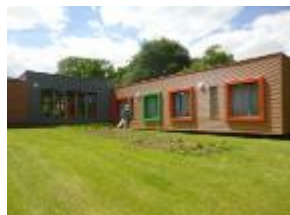
FAM Guérignan BIGNAN