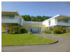
FAM Keruhel MONTERBLANC