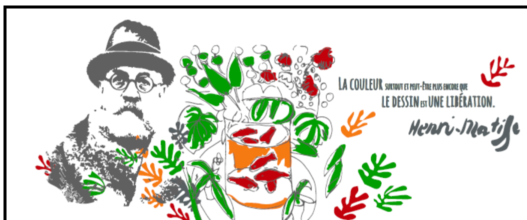
Fresque murale à l'entrée de l'Avenue Matisse (USLD)